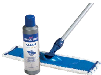
Quick-Step® CLEANING KIT QSCLEANINGKIT