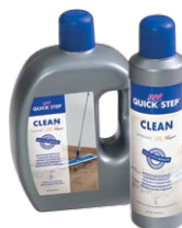
Quick-Step® CLEAN 750 ml QSCLEANING75 2000 ml QSCLEANING2000